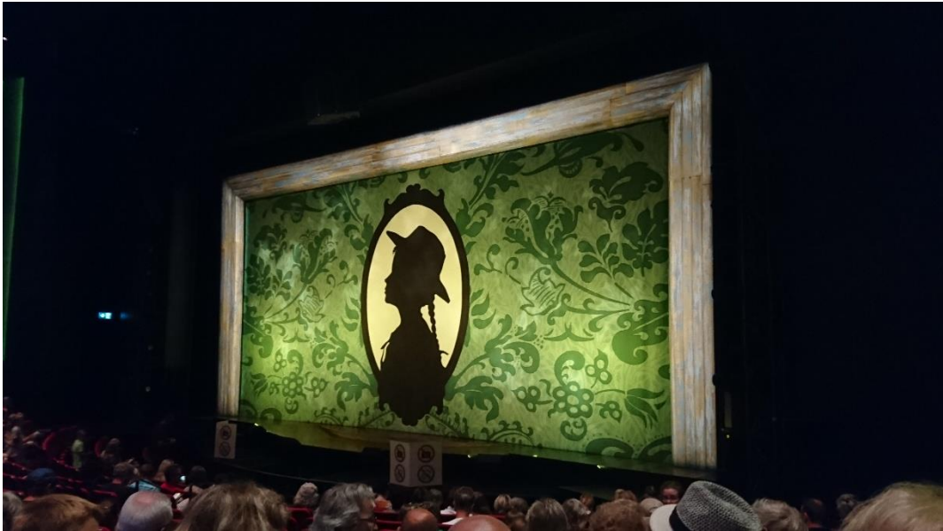
去看 Anne of Green Gable