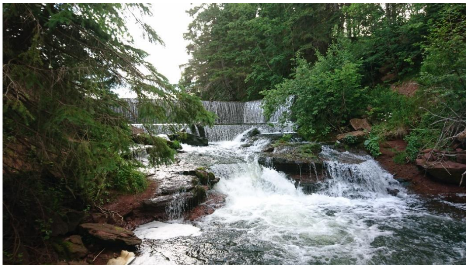
轟爸帶我去的秘境