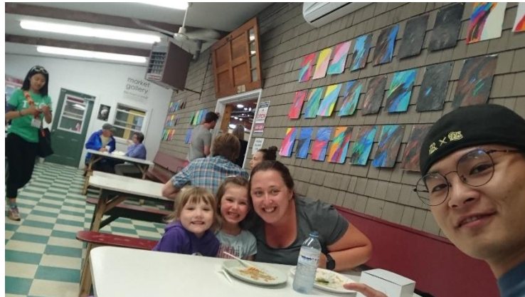
在農夫市集訪談消費者