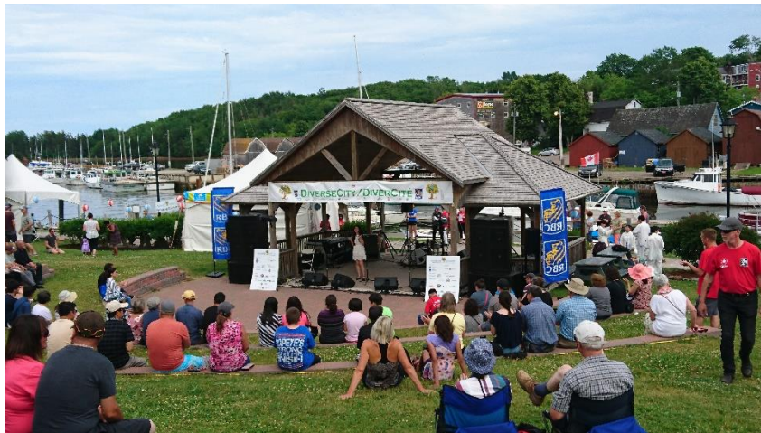
一年一度的 Diverse City