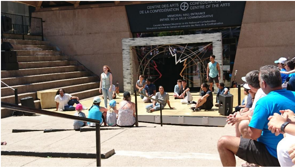
去市中心看 Young Performance