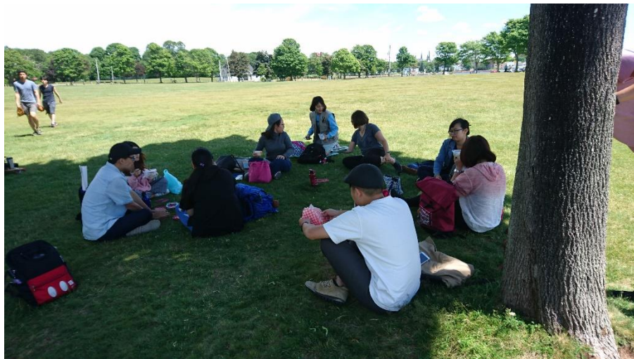
在維多利亞公園野餐