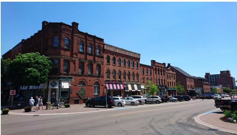
市中心美麗街景，彷彿置身英國