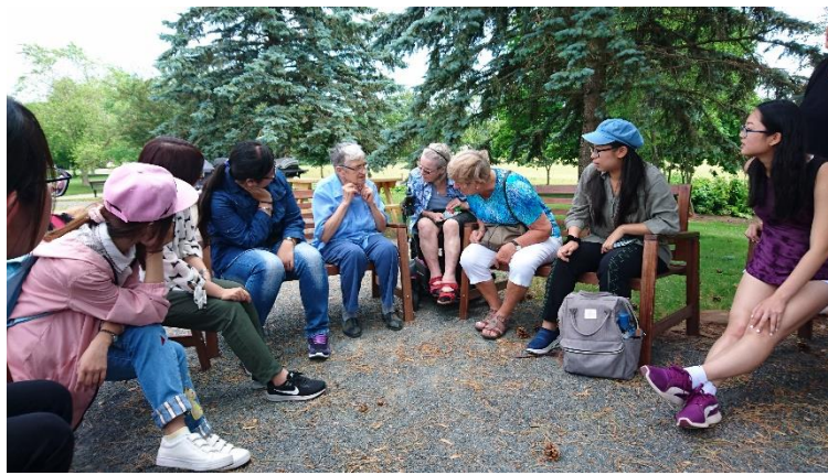
到老人院與長者聊天