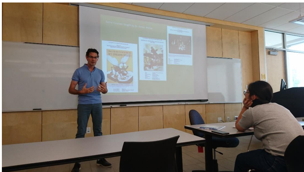
愛德華王子島大學歷史系教授上課