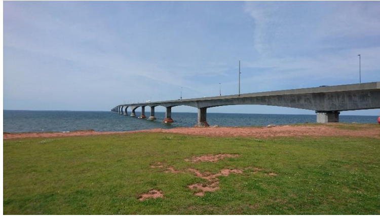
轟爸帶我去聯邦大橋