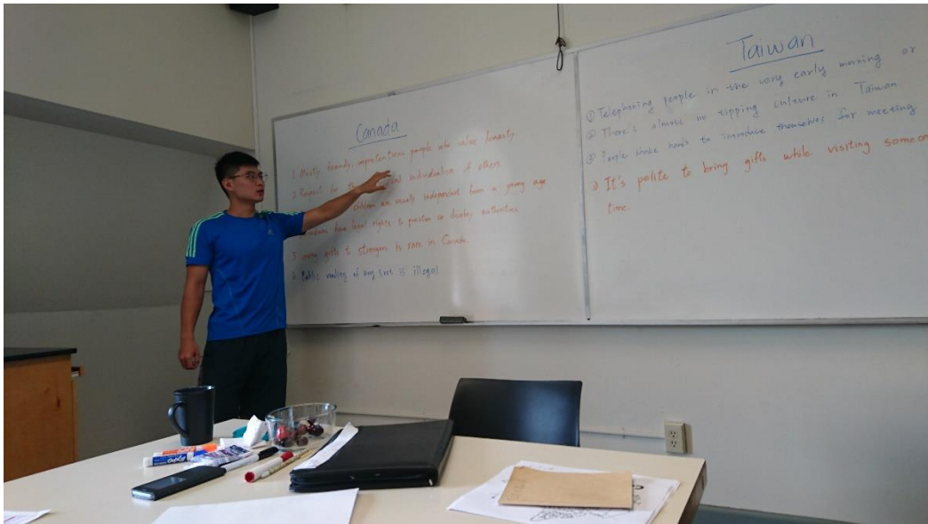
台灣與加拿大文化差異分享