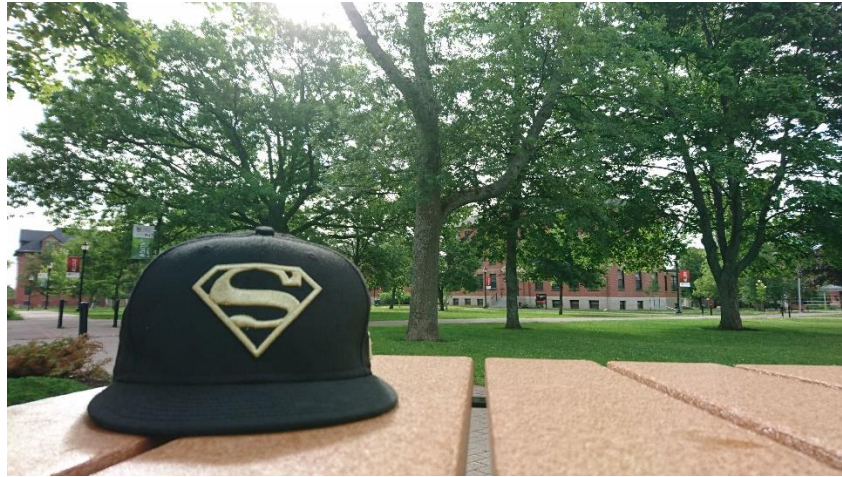
美麗安靜的校園讀書腳落