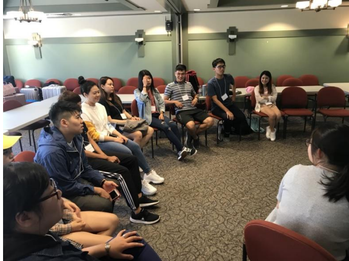
破冰遊戲及校園介紹