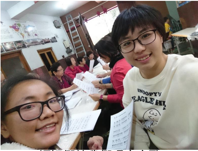
1 師姐們教我們唱客家歌