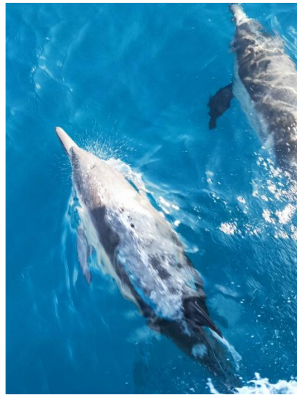
學校帶學生去賞鯨