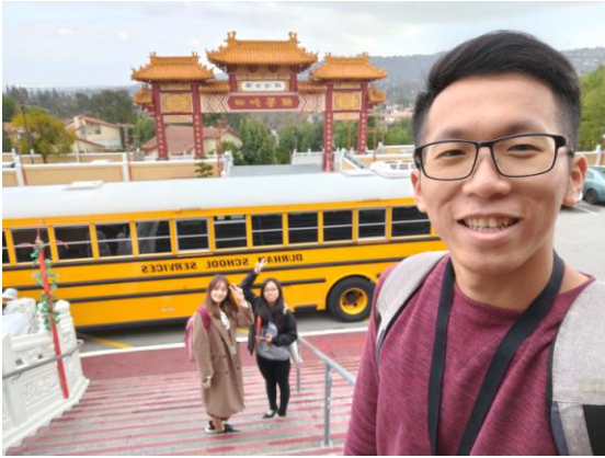
學校帶學生至西來寺參觀