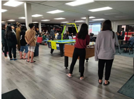
學校召開學生反映學餐的意見討論