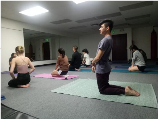
與當地認識的朋友一起做瑜珈