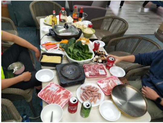
與當地朋友一起過除夕