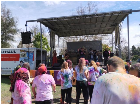
參加當地一個慶祝活動