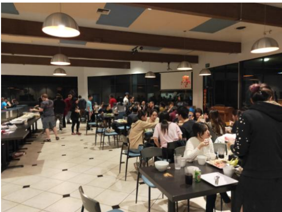
學校舉辦火鍋及抽獎