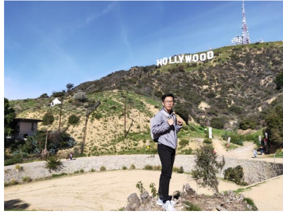
至 Hollywood 招牌走走