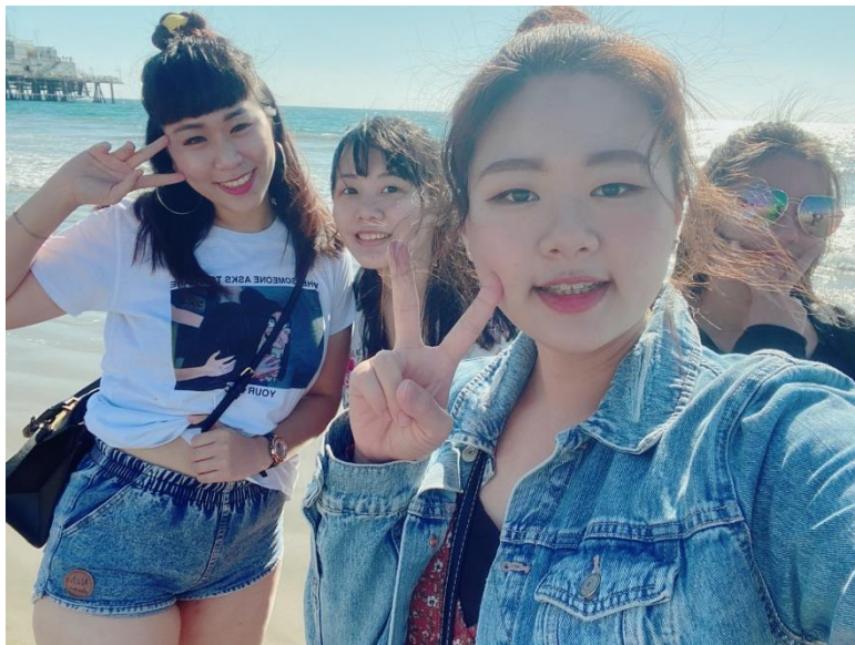
和朋友去 Santa Monica 海灘