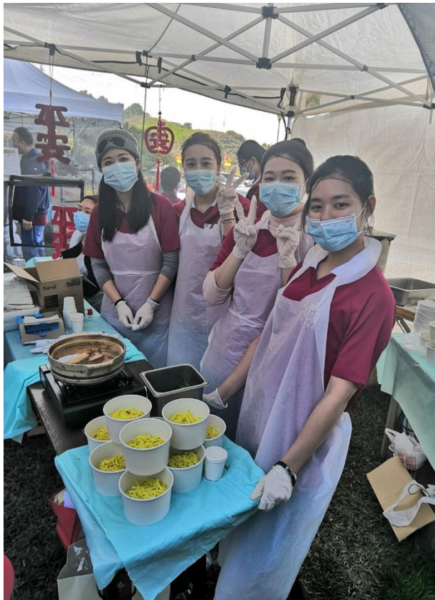
前往西來寺當義工