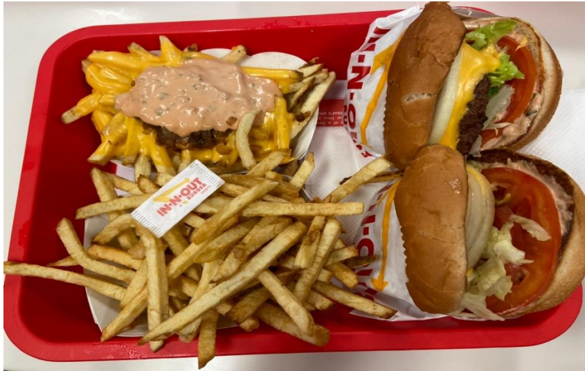
美國著名的 In-N-Out 漢堡