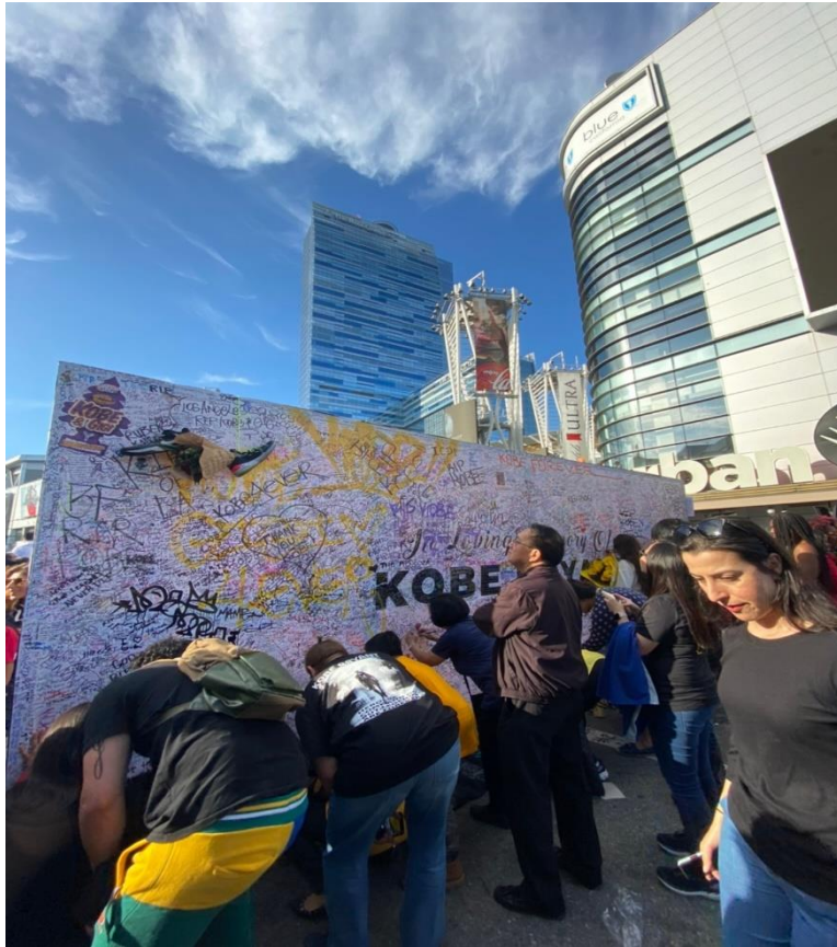
紀念 Kobe Bryant 的留言板