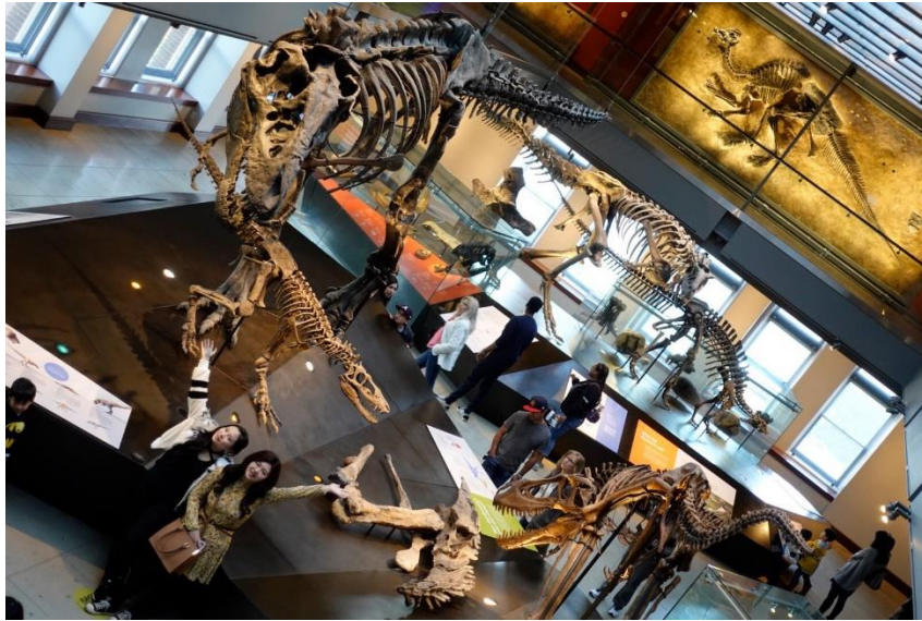
去歷史博物館看恐龍化石