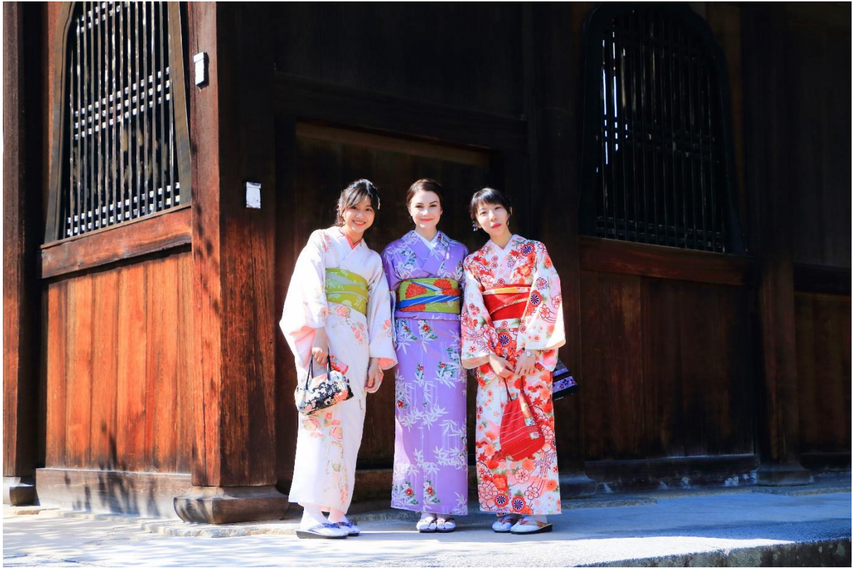
↑ 在體驗和服時遇到的一個穿和服超美的外國人 ↑