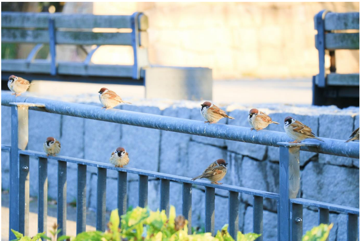
↑ 一群排排站的可愛麻雀 ↑