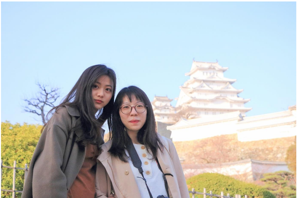
↑ 美美的姬路城 ↑