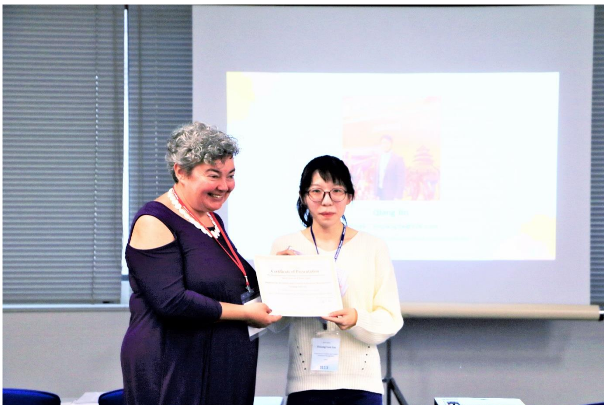
↑ ICBASS 研討會報告結束與會議主席合影 ↑