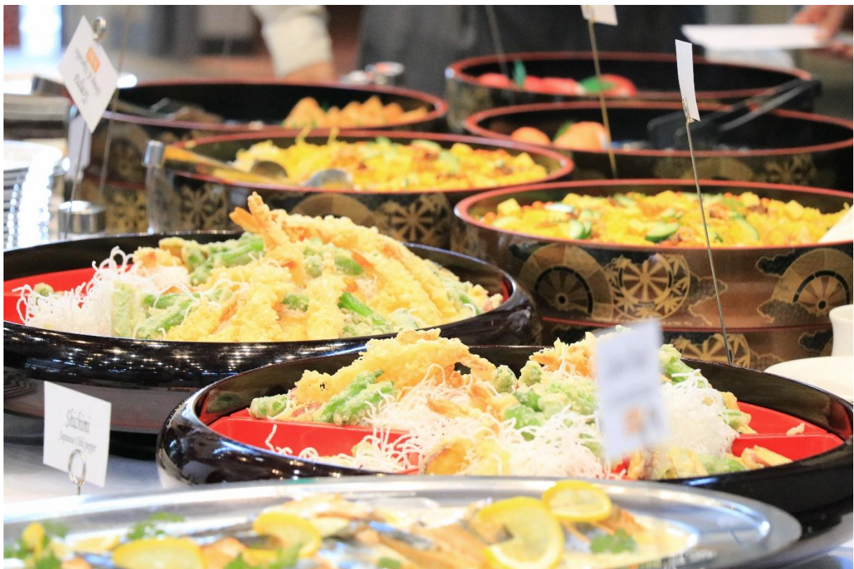
↑ ICBASS 研討會午餐 ↑