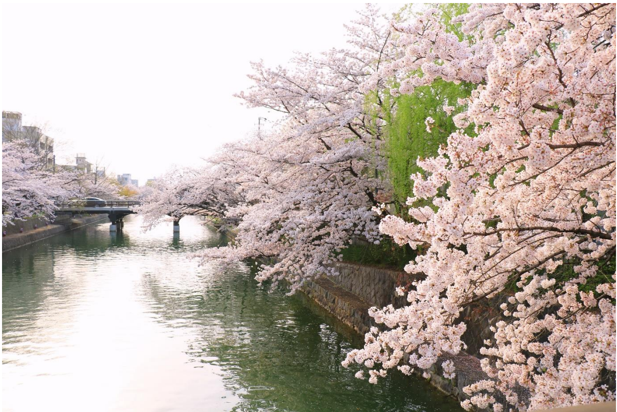
↑ 滿滿的櫻花樹 ↑