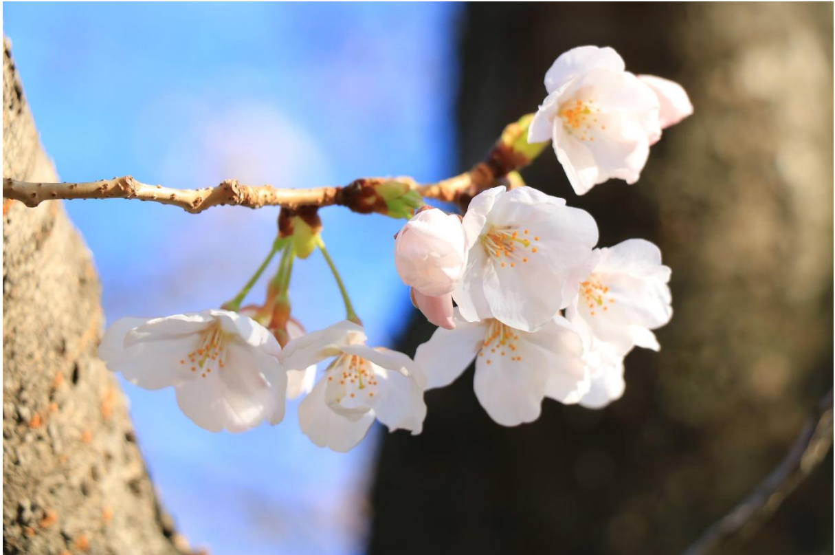
↑ 美美的櫻花 ↑