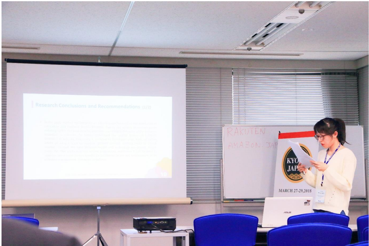
↑ ICBASS 研討會報告 ↑