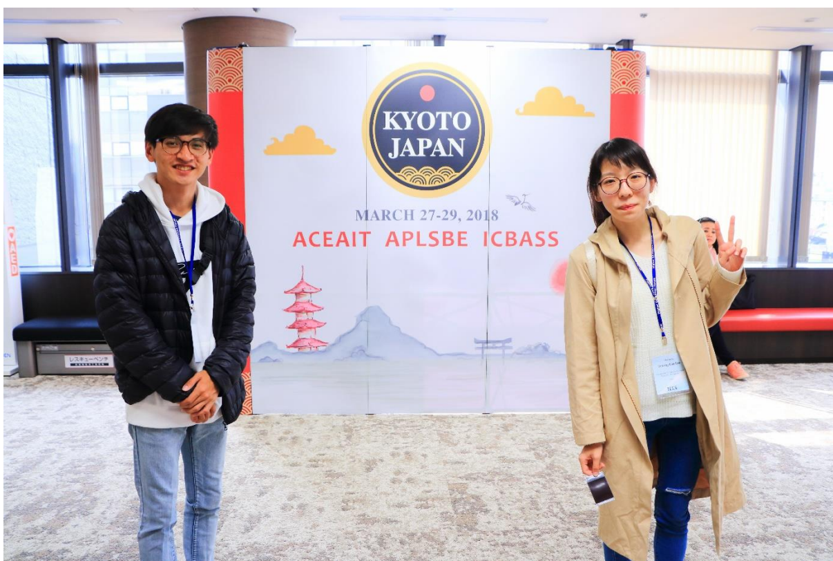
↑ ICBASS 研討會結束 ↑