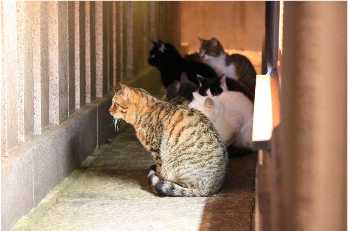
↑ 吃完晚餐後意外發現的貓巷 ↑