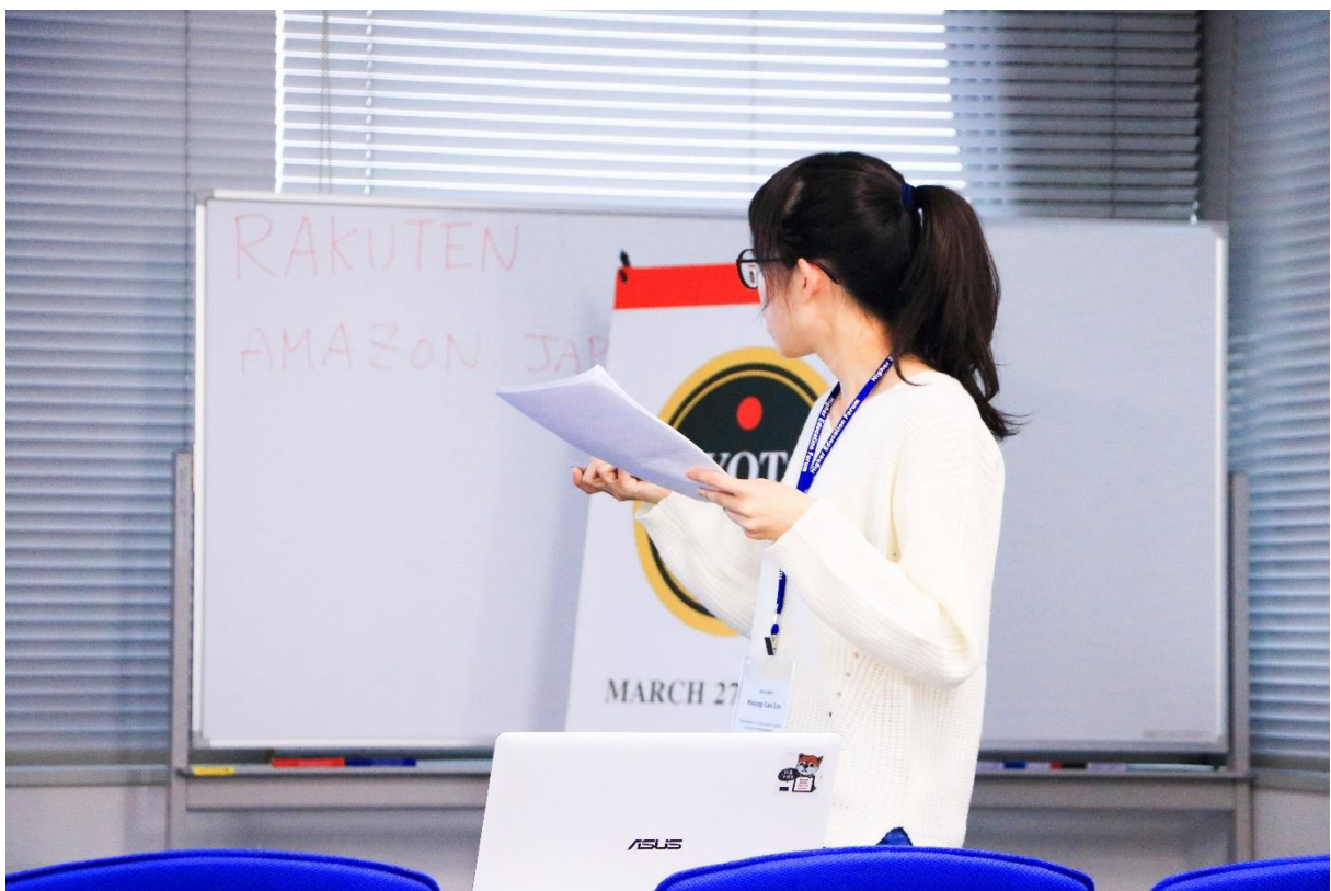
↑ ICBASS 研討會報告 ↑