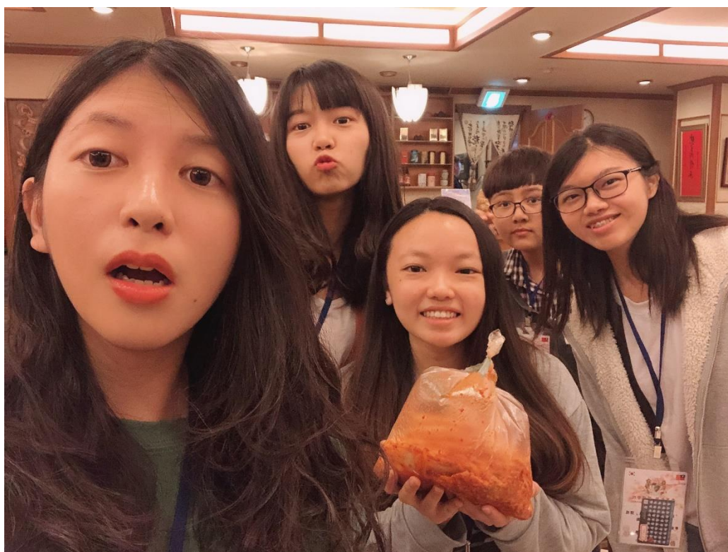
小組製作泡菜合照