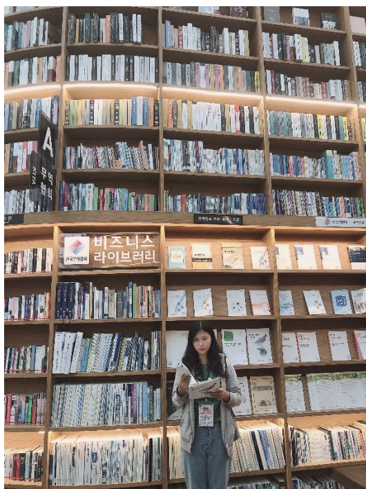
參訪韓國最美圖書館