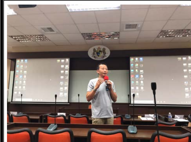
實習機構指導-長義閣