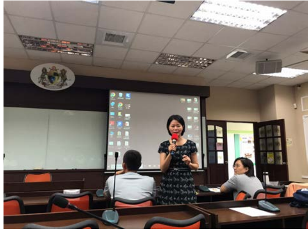
實習機構指導-愛木村