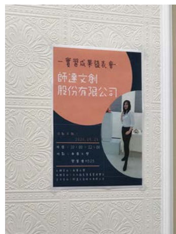
個人成果發表海報