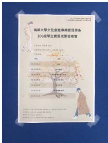
活動海報放置門口