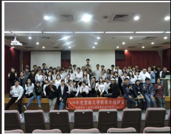
閉幕式結束後大家一起拍合照