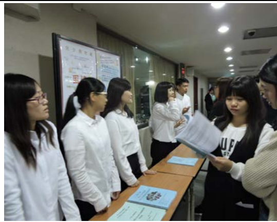
兒少預防組在真人圖書館時擺攤與學弟妹互動