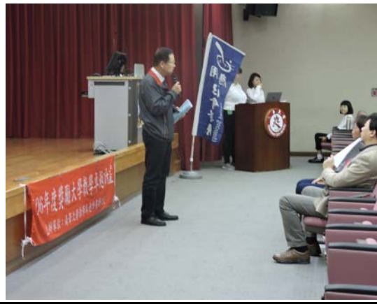
副校長為活動做完美的開場致詞