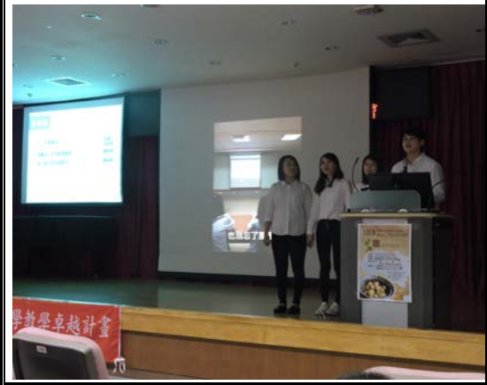
醫務組在分組報告時台上報告實習的點點滴滴