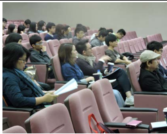
老師及學弟妹專注聆聽台上報告