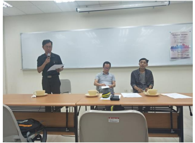
建築師分享與回應