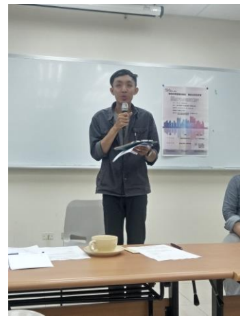
工程師分享與回應