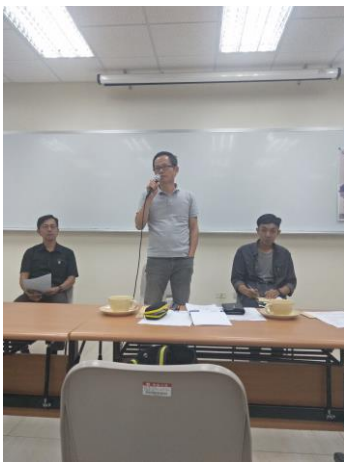
建築師分享與回應