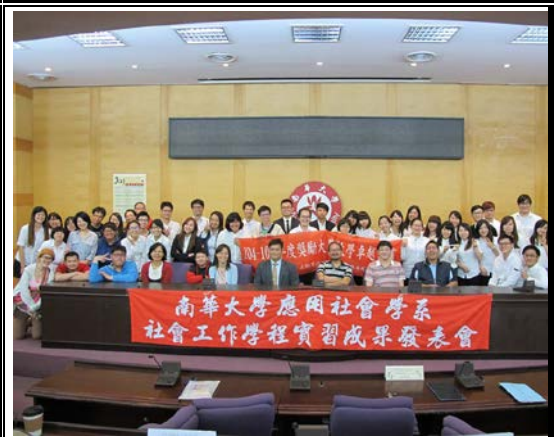
方案實習全體大合照