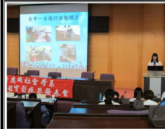
報告同學在台前分享實習內容