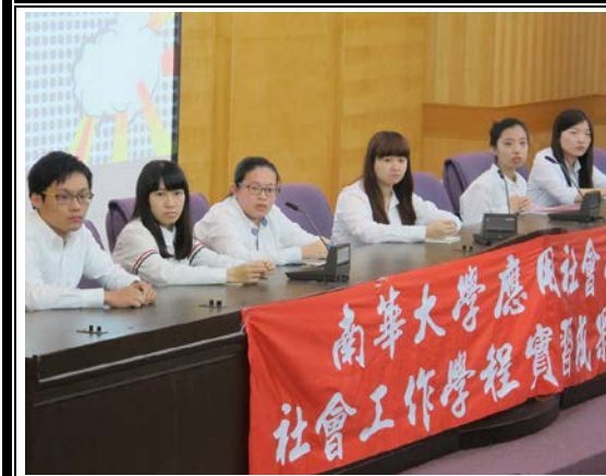
報告組別在台前接受師長同學回饋