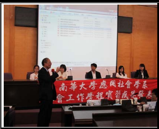
校長給予報告組員回饋分享