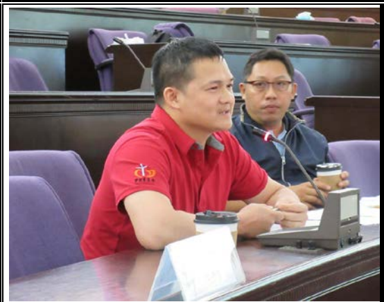
機構督導給予回饋及指教