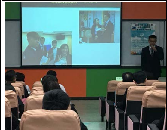
富邦人壽實習同學報告