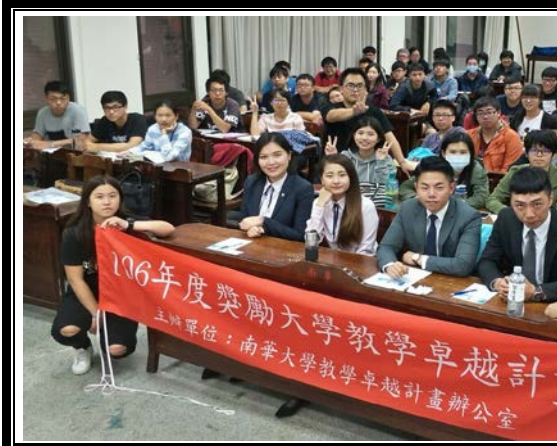
廠商先與系上同學經驗分享