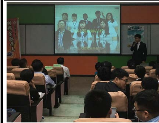
元大期貨實習同學報告