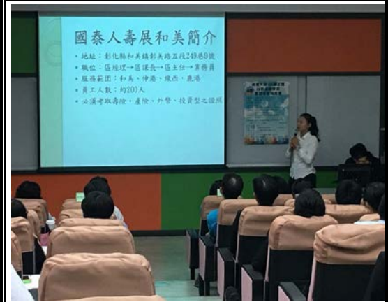
國泰人壽實習同學報告