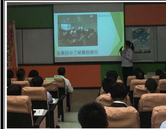
元大期貨實習同學報告