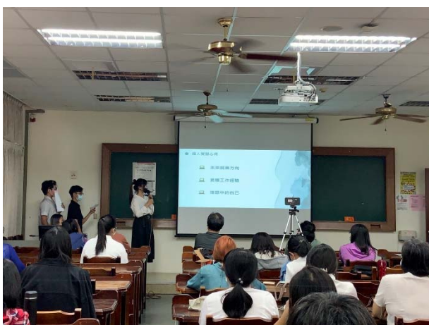
雲林縣政府文化觀光處圖書資訊科學生實習成果發表