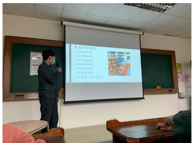
嘉義市世賢圖書館學生實習成果發表