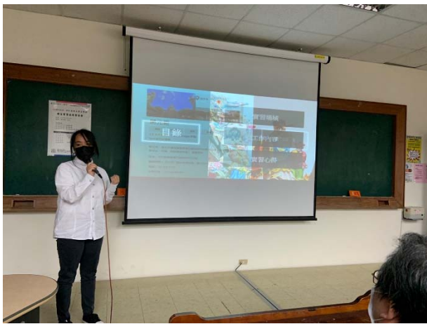
開元殿（鄭成功文物館）學生實習成果發表