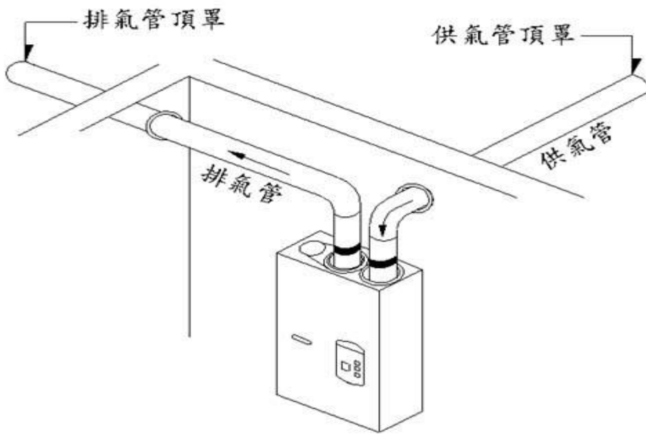
〈圖3〉室內強制排氣型熱水器安裝圖