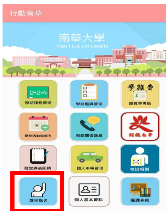
圖六. 學生課程點名。