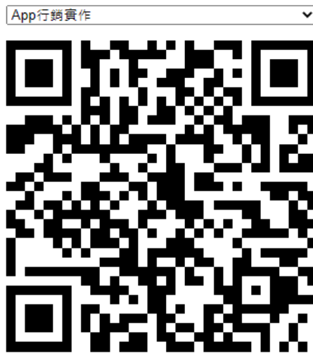
圖一. 老師開啟 QR code 點名系統掃描畫面。

Step2：過30分鐘後，系統會顯示未成功點名訊息列表於畫面上，由教師及學生進行確認，如圖二。