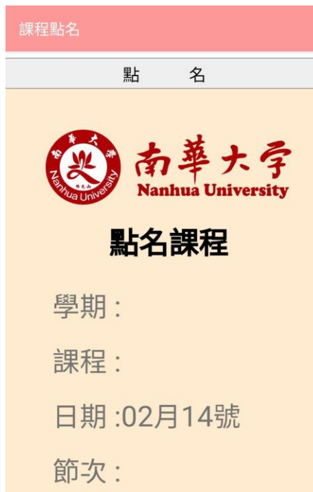
圖八. 確認點名完成。